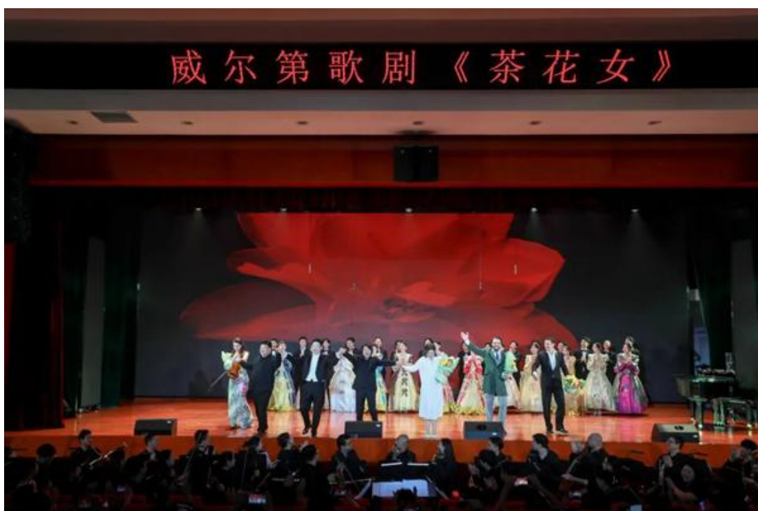
湖南工商大学音乐学院师生与俄罗斯艺术家联袂演出经典歌剧《茶花女》