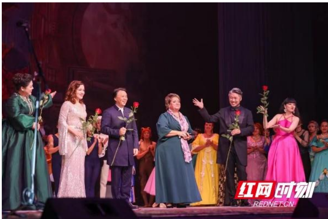
湖南工商大学音乐学院奏响第 77 届俄罗斯鄂木斯克国家歌剧院音乐节