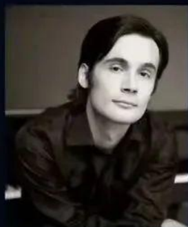
Евгений СТАРОДУБЦЕВ фортепиано