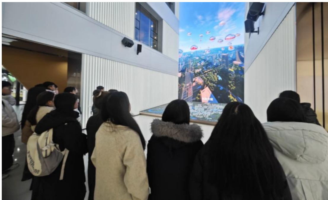
音乐舞蹈与人工智能卓越班在马栏山文化创意园开展调研活动

音乐舞蹈与人工智能卓越班依托音乐表演专业，遵循学校“新工科+新商科+新医科+新文科”与理科融合发展办学理念，坚持音乐舞蹈与人工智能协同发展、基础理论与基本技能并重、舞台表演与社会实践并重原则，学习音乐舞蹈基本理论、技术技巧和人工智能技术应用等知识，培养音乐舞蹈表演、创作、教育和科技融合型人才。音乐舞蹈与人工智能卓越班以学生音乐舞蹈应用能力培养为核心，践行实践育人理念，深化校企合作，推进产教融合，致力于为学生全面参与教育教学、科学研究、社会服务等活动创造条件，最大限度激发其潜能，鼓励学生直面挑战、不断探索、努力创造、追求卓越。