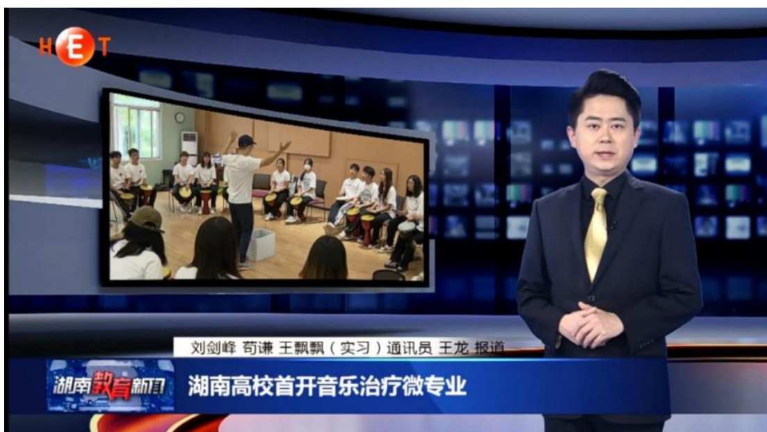
省教育电视台报道心理健康与音乐治疗微专业