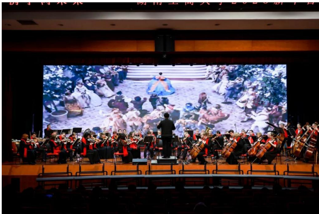
与世界著名交响乐团——俄罗斯交响爱乐乐团合作举行 2025 新年音乐会